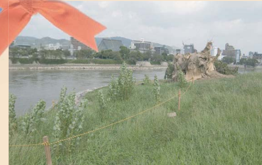
▲2004年9月7日、台風18号に倒れたポプラの木、ポップラの足もとで成長していたベビーポップラ