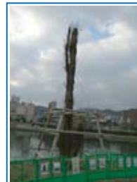
▲2004年9月7日、台風で倒れた後、官民一体となり植え直した。再生に向かうポップラ。